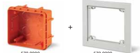
572.0200 + 572.0220 IP55