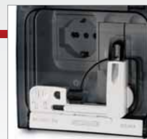
Bezpečnostné dvere s hermetickým uzáverom