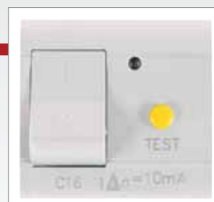
Možnosť pripojenia cez istič kombinovaný prúdovým chráničom