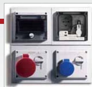
Kompatibilné so SCAME modulárnym systémom